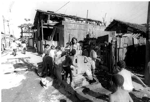
figura 80 - Condições de moradia na comunidade Mandela de Pedra. (CCS Fiocruz, 2003)

Em virtude deste baixo nível de exigência, foi constatada uma razoável satisfação com o ambiente construído do Centro de Saúde, considerado agradável e saudável pela maioria dos respondentes. Este dado nos leva ainda a outra constatação: a de que as relações sociais que se estabelecem num determinado ambiente – e que são favoráveis no Centro de Saúde - são atributos extremamente importantes para um ambiente agradável e saudável, para este grupo de usuários. Além disso, por se tratar de uma instituição pública, percebemos que há uma tendência a aceitar o ambiente tal como está, como uma espécie de "gratidão" pelo serviço "gratuito", conforme descrito por Sommer (1973). Para Marilice Costi, “como a maioria deles não reivindica qualidade no ambiente que os abriga, pois dependendo da classe social a qual pertencem, desconhecem seus direitos de cidadãos e quando conseguem consulta estão mais que satisfeitos, eles aguardam em qualquer local...” (COSTI, 2002: 38)