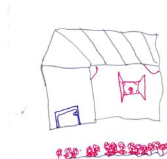
Figura 81 – Imagens representativas da preferência tipológica dos usuários

Já em relação às salas de espera, a preferência é por espaço amplos, bem iluminados e com presença de vegetação. Nas imagens preferidas, destacam-se também os atributos limpeza, tranquilidade, organização e ventilação. Rejeitam ambientes monótonos e pequenos. A análise dos resultados da seleção visual e das matrizes de mapeamento visual indica que os usuários internos tendem a associar atributos negativos aos ambientes onde há fluxo e/ou concentração de usuários externos. Por outro lado, ambientes utilizados apenas por funcionários, ou com uso restrito de usuários externos, são associados a atributos positivos.