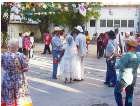
figura 77 - Quadrilha na festa junina conta com a participação do chefe e de pacientes. (PENNA, 2003)

Outra característica que percebemos no Centro de Saúde é a forte relação que a instituição tem com a comunidade. Ao adotar uma proposta de promoção da saúde radical nos últimos anos, como afirma a atual chefia 45 , a relação com a comunidade extrapola a assistência e a orientação para saúde convencional. Há um forte sentido de pertencimento da comunidade em relação ao Centro de Saúde e vice-versa. Durante esta pesquisa, por diversas vezes tivemos a oportunidade de participar de atividades e eventos organizados pelos grupos de promoção da saúde e pela própria administração do Centro de Saúde, que promovem a integração entre usuários internos e externos (figuras 77 e 78). Ainda que esta integração não seja uma realidade para toda a comunidade de Manguinhos, a impressão é que o Centro de Saúde hoje é uma instituição acessível e plenamente integrada à comunidade.