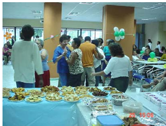
figura 78 - Baile promovido Programa de Assistência à saúde do idoso (PASI). (PENNA, 2003)

Diante destes fatos, este ambiente se revelou um objeto de estudo extremamente favorável à imersão exigida na abordagem adotada na pesquisa. Logo nas primeiras idas a campo, foi possível se sentir parte desta organização social, e conhecê-la através experiência cotidiana, que deu origem às reflexões que embasam estas análises.