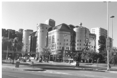
Figura 3 – Centro Empresarial Mourisco

A intervenção humana na paisagem contém diversas características do processo de urbanização do Rio de Janeiro: praia e ar poluídos, morro devastado/modificado por túneis, viadutos e cortes; aterro de lagoas, áreas alagadiças e praia; frequência de engarrafamentos e de alagamentos; seu cenário é marcado pela variedade de edifícios que destoam entre si por sua variedade de cores, volumetria, gabarito, partido de implantação, por sua aparência inusitada (Fig. 3) ou pelo seu uso.