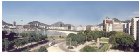
Figura 2 – Vista da Enseada de Botafogo

Minha condição de morador me transforma em parte integrante de sua organização social local da qual sou parte. A vista da enseada através da janela de meu apartamento (Fig.2) e as caminhadas diárias na avenida Beira-mar ou na Praia de Botafogo contribuíram para uma experiência “criadora de questões e significações” que condicionam o modo como percebo e me relaciono com o sítio. Em outras palavras, possuo uma identidade comum ou cidadania sistêmica com a Praia de Botafogo.