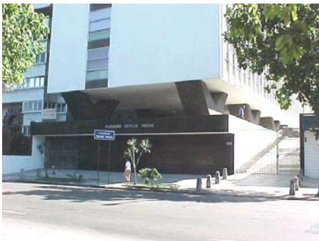
Figura 8 – Edifício da Fundação Getúlio Vargas

confirma-se a função corroboradora do Estado em relação aos interesses da iniciativa privada apontada por Sérgio SANTOS (1981).