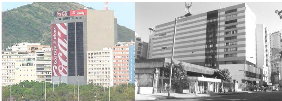
Figura 6 – Edifício Coca-Cola/Intelig. Figura 7 – Edifício-sede da Telemar.

Para Sérgio SANTOS, a área evidencia que o “poder público não tem senão corroborado tendências ‘espontâneas’, implementando serviços e infra-estrutura urbana e mesmo regulamentando, onde a iniciativa privada já ‘criou o fato.’” O autor explicita a lógica do processo de desenvolvimento da cidade: dependência das soluções técnicas em relação às condições e interesses políticos dos grupos que comandam a Administração Pública que dificulta e/ou impede sua implementação; ação regulamentadora do Poder Público apenas corrobora a ação da iniciativa privada, principal elemento criador de tendências de transformação do espaço urbano. Neste sentido, Botafogo “mostra os efeitos dessa ação conjugada, ao refletir em seu espaço os efeitos transformadores impostos por sua recriada função de passagem” (SANTOS 1981: 214).