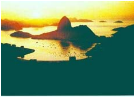
Figura 1: Vista Aérea da Enseada de Botafogo