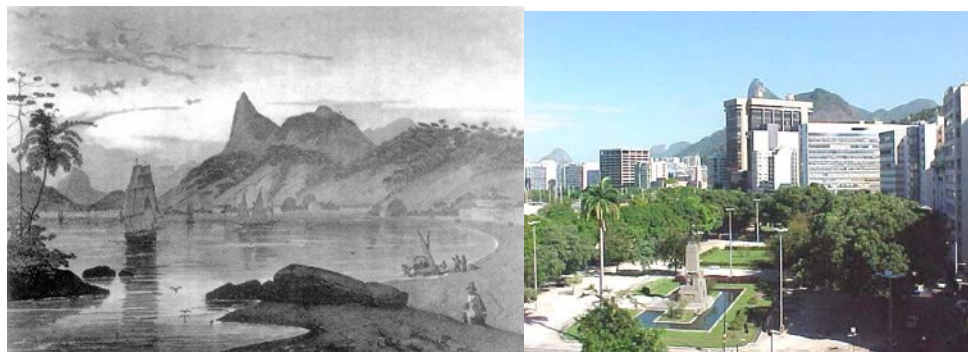
Figura 4 – Paisagem Natural da Enseada de Botafogo Figura 5 – Vista Atual da Enseada de Botafogo Fonte: Rugendas (1824)

ou através do confronto entre imagens colhidas no início do século XIX (Fig. 4) e a situação de atual, desfigurada por um processo de ocupação que despreza o contexto e a geografia do sítio (Fig. 5).