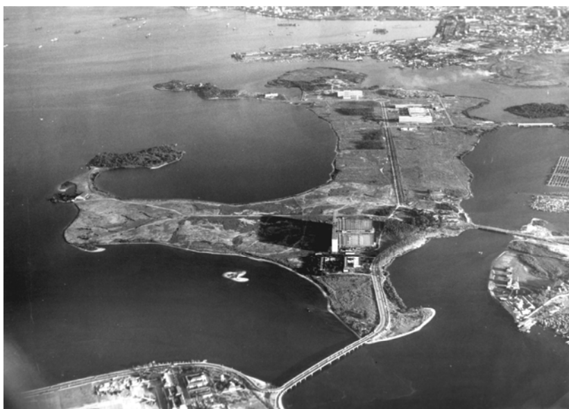
FIGURA 1: ILHA DO FUNDÃO FONTE: ARQUIVO DA PREFEITURA UNIVERSITÁRIA DA UFRJ (1954)

Em 1959, o presidente Juscelino Kubitschek, através do Decreto 47.535, denominou a ilha resultante da fusão do arquipélago original de Ilha da Cidade Universitária da Universidade do Brasil. (Figura 1)