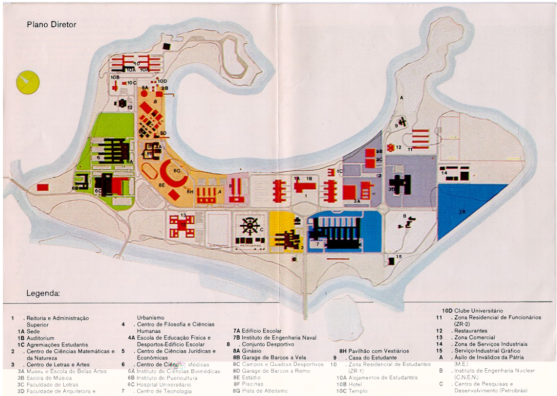
FIGURA 2: PLANO DIRETOR DE 1972

O Plano diretor compreende, então, grandes edifícios destinados aos Centros, complexos arquitetônicos que aglutinam várias unidades afins; edifícios destinados à Administração Superior, instalações desportivas, residências para estudantes e para funcionários (agora, apenas para os de manutenção e vigilância) e instalações de serviços gerais, reduzindo-se, então a área total de construção para 750.000 m2 aproximadamente.