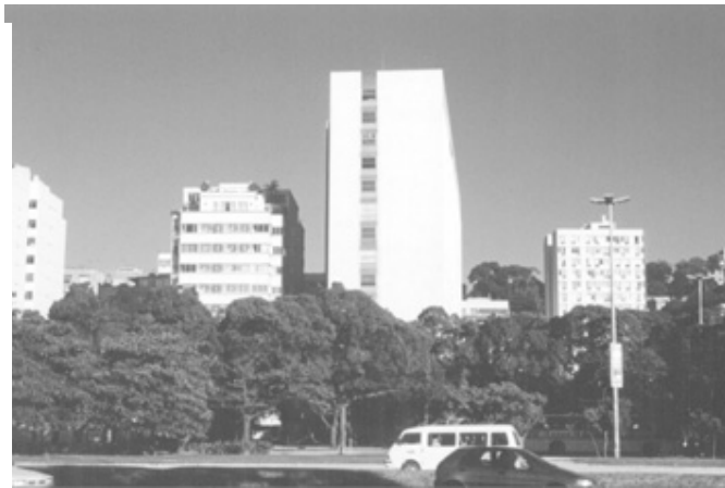
Figura 10 – Vista do edifício da Fundação Getúlio Vargas

Fachada “cega” e a sombra que projeta sobre o edifício vizinho. Desproporção, ruptura e falta de integração com o sítio e com o clima local.