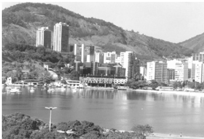
Figura 23. Vista do Morro do Pasmado.

Ocupado pelo conjunto de edifícios do condomínio Casa Alta. Ocupação inadequada da encosta. À frente, o exótico Centro Empresarial Mourisco. Casuísmo do poder público, degradação tecnicista e doutrinária.