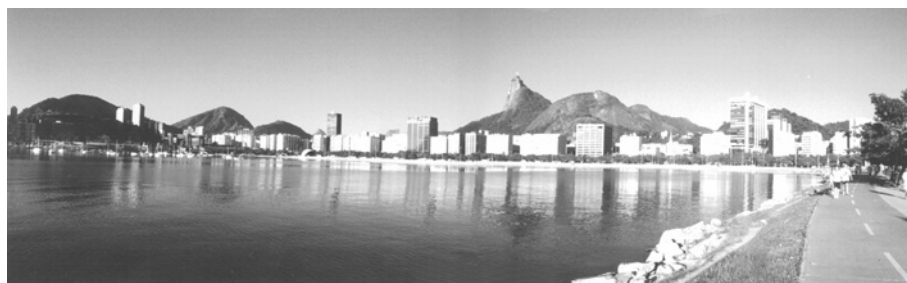
Figura 3 – Vista Panorâmica da Enseada a partir do Morro da Viúva

Esta figura evidencia a relação aleatória entre a massa edificada e o perfil natural dos morros. Fragmentação da paisagem, fruto da prevalência da concepção do edifício como obra isolada de arquitetura em detrimento de seu relacionamento com o contexto. O conjunto de intervenções no sítio releva a presença de diversos objetos [principalmente edifícios] ávidos por atenção. Arquitetura como protagonista do processo de degradação da paisagem natural: monumentos da irracionalidade. Limites