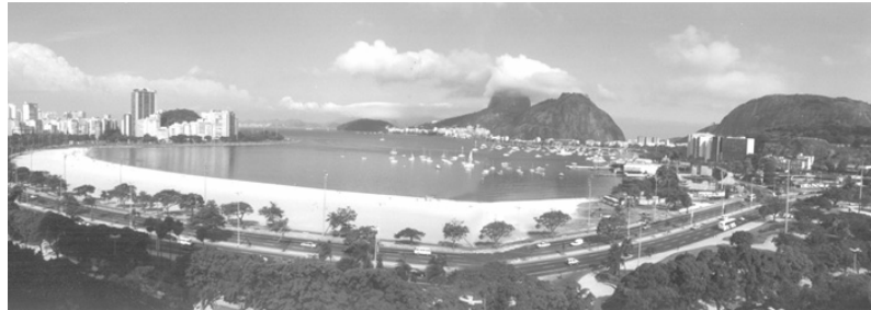
Figura 1 – Vista da Enseada de Botafogo (2000)

À esquerda, o conjunto de edifícios do Morro da Viúva. Ao centro e ao fundo, Pão de Açúcar e bairro da Urca. À direita, Morro do Pasmado e Iate Clube.