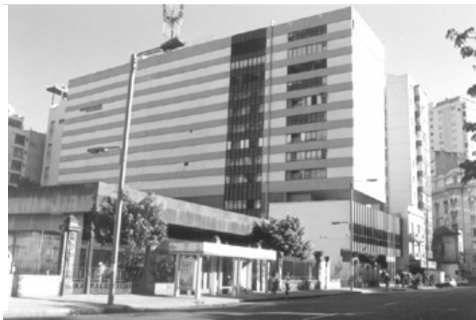
Figura 24 – Vista dos edifícios Anexo da Fundação Getúlio Vargas e da Telemar.

Abrigo de Ônibus obstruindo o passeio de pedestres evidencia a falta de conexão entre as diversas instâncias do poder público municipal. Edifícios sem conexão com o sítio. Degradação tecnicista e casuísmo do poder público.