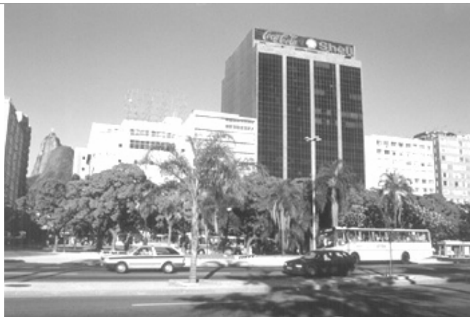
Figura 15 – Vista dos edifícios Coca-Cola/Intelig e Botafogo Praia Shopping

À direita, o antigo edifício Rajá; à esquerda, rua Professor Alfredo Gomes, com os edifícios Botafogo Praia Shopping, Banco do Brasil, e o desproporcional e escuro edifício Coca-Cola/Intelig. Ao fundo, escondido entre a massa edificada, o Corcovado – somente visível no trecho correspondente à rua Professor Alfredo Gomes. Relação aleatória do edifício com o ambiente. Edifício ávido por atenção.