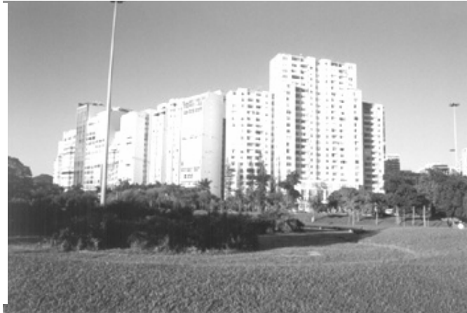
Figura 4 – Vista do Paredão de edifícios junto ao Morro da Viúva.

Evidência da ocupação irracional do sítio e descaso com a paisagem natural. Degradação tecnicista.