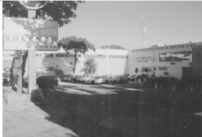
Figura 19. Vista do edifício do Corpo de Bombeiros.

Ocupação de área proteção ambiental, embora para uso público, pintura vermelha agride a já poluída paisagem local. Casuísmo das autoridades públicas, degradação tecnicista/pop-degradação e relação aleatória dos edifícios com o contexto.