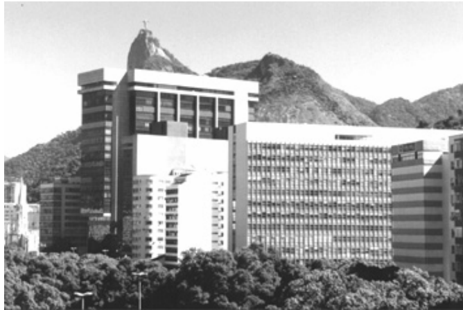
Figura 22. “Paredão” de edifícios

Bloqueio da vista do perfil das montanhas que contornam a enseada de Botafogo. Edifícios-coletores solar Argentina e Fundação Getúlio Vargas. Edifícios ávidos por atenção.