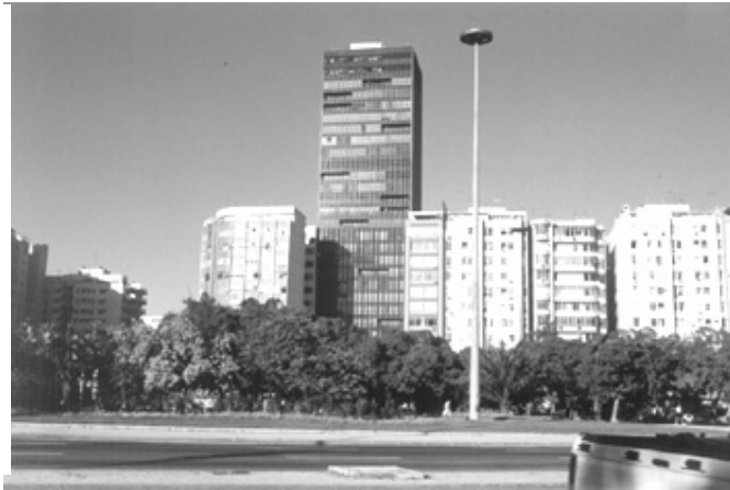
Figura 16. Edifício Praia de Botafogo 440.

Ruptura de gabarito, de alinhamento e de cor/textura da aparência externa. Massa edificada bloqueia a vista do Corcovado e da paisagem natural. Edifício como obra isolada