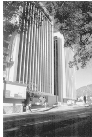
Figura 20. Edifícios “gêmeos” da IBM.

Falta de vagas de garagem tumultua o trânsito nas alças de acesso à Avenida Nações Unidade (Aterro) e retorno a Copacabana