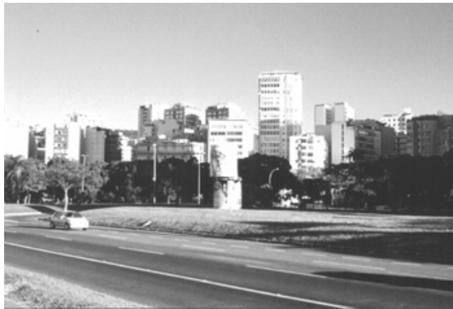
Figura 7 – Vista do conjunto de edifícios da Praia de Botafogo.

Trecho compreendido entre a avenida Osvaldo Cruz e ruas Senador Vergueiro e Marques de Abrantes. Fragmentação do tecido urbano e da morfologia da massa edificada: relação aleatória entre a concepção dos edifícios e o contexto.