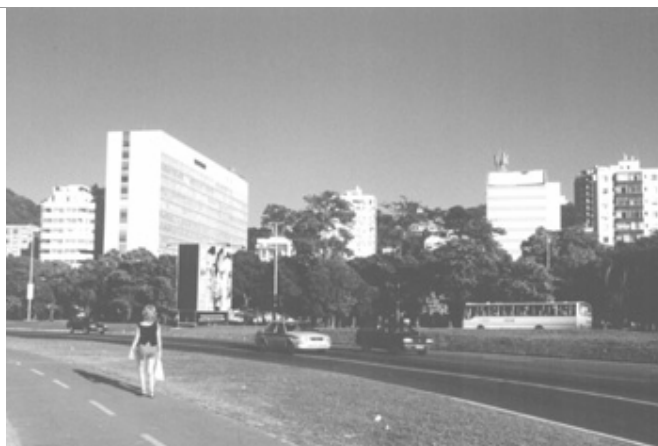
Figura 9 – Vista dos edifícios “cegos” (sem janelas para a Praia de Botafogo)

Edifícios da Telemar e da Fundação Getúlio Vargas, situados no trecho entre as ruas Marquês de Abrantes e Farani. As fachadas envidraçadas do edifício da Fundação Getúlio Vargas, voltadas para Leste e Oeste, funcionam como coletor solar e obrigam seus usuários a colarem folhas de papel opaco, para reduzir a incidência da radiação direta do sol.