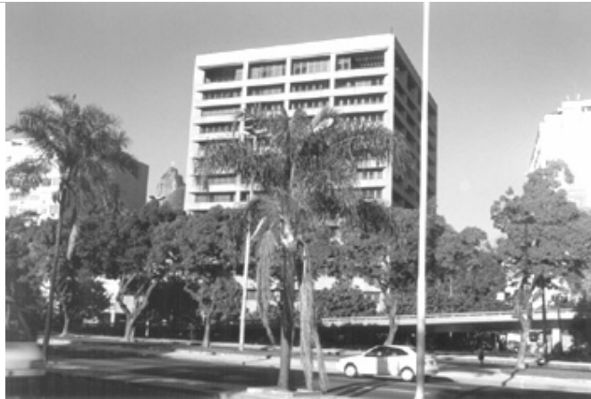
Figura 13 – Vista do edifício Caemi, com o Corcovado ao fundo.

Mesmo sendo considerado um dos melhores projetos de edifícios de escritórios do Rio de Janeiro, sua massa evidencia descompromisso com a paisagem natural e com o ambiente.