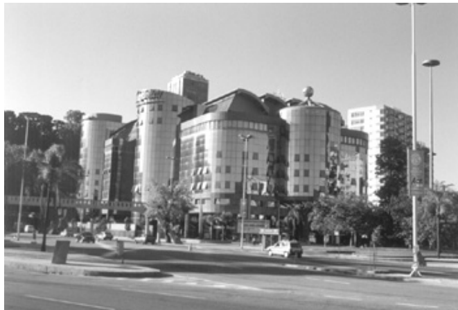
Figura 17. Centro Empresarial Mourisco.

Privatização de área pública de proteção ambiental. Extravagância formal e de materiais. Edifício como obra isolada, ávido por atenção e casuísimo das autoridades públicas.