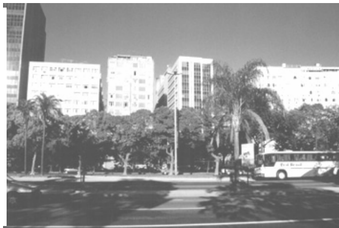
Figura 14 – Vista de conjunto de edifícios próximos à Rua Visc. de Ouro Preto

À direita o edifício do antigo cinema Ópera (atual Casa e Vídeo); à esquerda, parte do edifício Coca-Cola/Intelig). Ao centro, o mal afamado edifício Rajá, conhecido pelos problemas decorrentes da excessiva densidade populacional