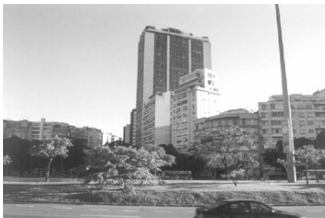
Figura 6 – Vista do conjunto de edifícios da Praia de Botafogo.

Trecho compreendido entre as avenidas Rui Barbosa e Osvaldo Cruz, onde se destaca o edifício Apolo com seus 28 pavimentos. Evidência da prevalência dos interesses imobiliários e do casuísmo das autoridades públicas [liberação de gabarito]