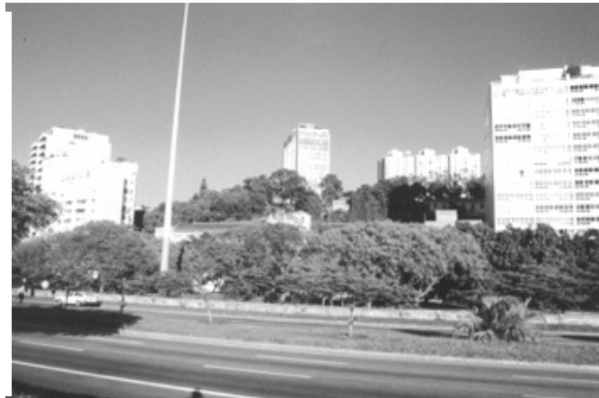
Figura 5 – Vista do Morro da Viúva junto ao Instituto Fernandes Figueira.

Único trecho visível do morro. Ao fundo, aparecem as torres dos edifícios Apolo (ao centro) e o conjunto de edifícios da Avenida Osvaldo Cruz. Memória dos primeiros edifícios e descontinuidade de massa edificada.