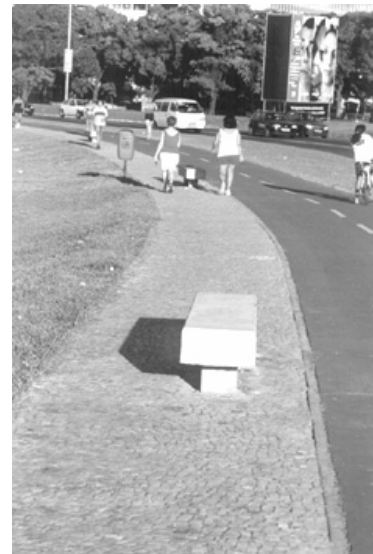
Figura 8 – Banco obstruindo o passeio de pedestres.

Evidência de falta de articulação entre os organismos municipais e falta de lógica na concepção. Se instalado na grama, além de evitar a obstrução do trânsito de pedestres, o banco possibilita maior conforto para seus frequentadores – a grama ameniza as radiações térmica e luminosa.