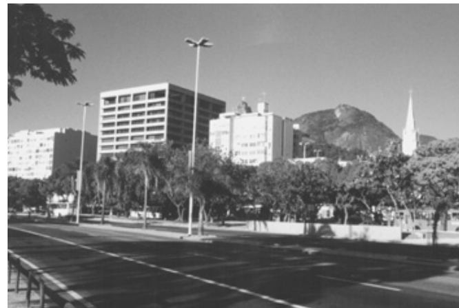
Figura 12 – Vista da Torre da Igreja da Imaculada Conceição e do edifício Caemi.

Ao fundo, o Corcovado evidencia a desproporção da massa edificada em relação à paisagem natural.