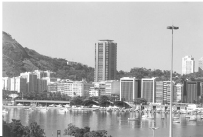
Figura 21. Vista do conjunto de edifícios da Avenida Nestor Moreira.

Edifícios “gêmeos” da IBM, Corpo de Bombeiros, Restaurante Sol e Mar e hangares do Iate Clube. Ao fundo, a torre do edifício-shopping center Rio-Sul, um dos mais altos do Rio de Janeiro.