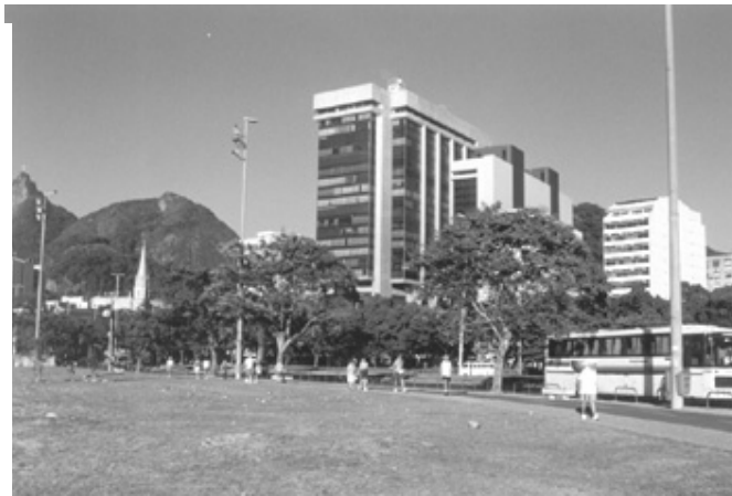
Figura 25 – Vista do Edifício Argentina

A partir do local onde deverá ser construído o memorial às vítimas do holocausto. Arquitetura como protagonista principal de um ambiente onde a exuberante paisagem natural é relegada à condição de coadjuvante, quando não é completamente ignorada.