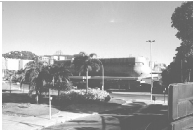
Figura 18. Vista da Piscina do Botafogo Futebol e Regatas.

Privatização de área pública de proteção ambiental. Extravagância formal e uso inadequado de material – massa de concreto aparente obstruindo a vista da enseada. Casuísimo das autoridades públicas.