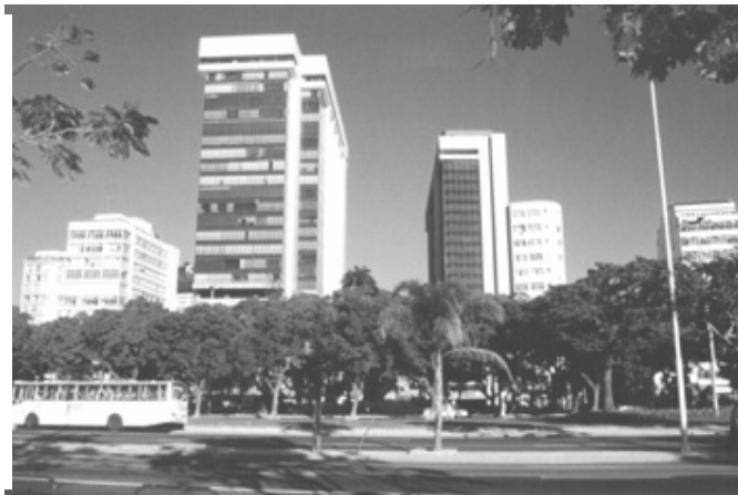
Figura 11 – Vista do edifício Argentina.

Ruptura e desproporção do gabarito. O edifício, com suas fachadas de vidro, também funciona como coletor solar. Concepção desconsidera o clima local. Casuísmo das autoridades públicas [liberação do gabarito]