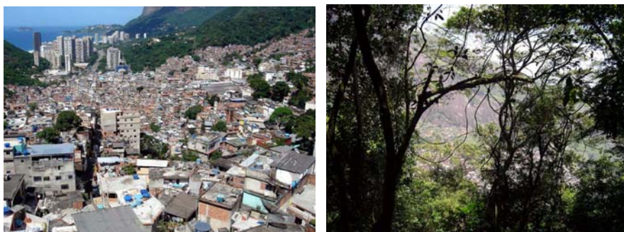
Figura 5 – Vista geral, avanço da ocupação sobre a mata e verticalização

A Lei nº 3.693, que instituiu, em 2003, a Área de Relevante Interesse Ecológico-ARIE de São Conrado é um dos instrumentos de controle do uso do solo criados para conter essa expansão normalmente discreta, paulatina e difusa, trazendo para as agências governamentais de controle enormes dificuldades de atuação, o que só pode ser superado com a participação da sociedade e ações relacionadas a projetos de drenagem das águas pluviais, esgotamento sanitário, coleta de lixo e educação ambiental.