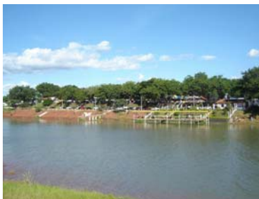
Represa de Jurumirim

Questões como aproveitamento turístico e investimentos imobiliários de média e alta rentabilidades foram, nesse contexto, as argumentações contrárias à aplicação das novas resoluções ambientais do Conama, principalmente se consideradas as potencialidades decorrentes da criação de uma área de reserva hídrica de grandes proporções aplicada a um município de grande acessibilidade como Avaré, junto a São Paulo.