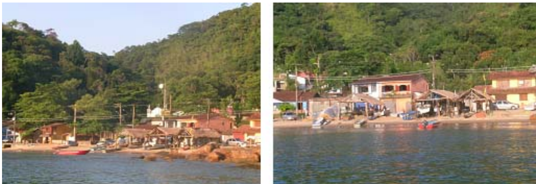
Figura 4 – Vila de Picinguaba -Núcleo urbano e ocupação da orla