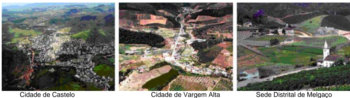
Figura 2 - Região Serrana do Espírito Santo- aspectos dos núcleos urbanos

Nesse caso, as características culturais de ocupação urbana dificultaram a possibilidade de saneamento dos rios e canais, junto aos quais os núcleos se assentaram. Nas áreas rurais, as formas de produção impactam intensivamente as APP's de forma direta, pois além de contribuírem para a deterioração das condições de qualidade dos recursos hídricos foram responsáveis pela extinção de grandes extensões de reservas florestais.