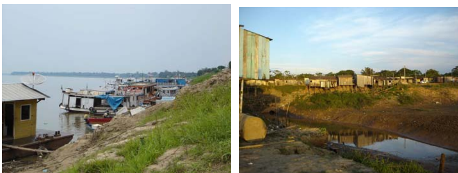
Figura 6 – Aspectos das ocupações ribeirinhas do Rio Madeira

É importante ressaltar que as populações locais pertencem, em sua totalidade, a comunidades rurais ou pequenas comunidades urbanas que possuem uma forte relação com as atividades ribeirinhas, onde o trabalho gira em torno da pesca, do garimpo e da agricultura de várzea, praticados nos períodos de vazante das águas do rio.