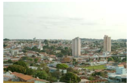
Aspectos da cidade