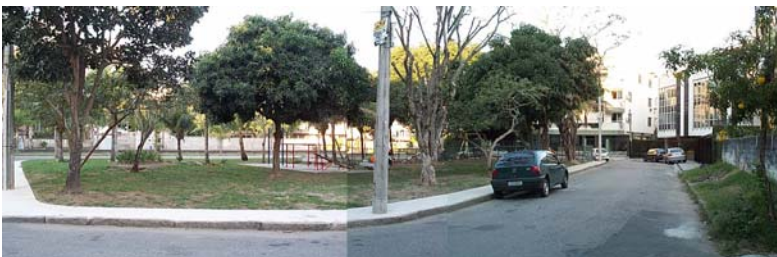
Aspecto da Praça São Probo. Montagem de fotos.

A grande facilidade de acesso dada pela avenida, onde a via se inicia e termina, acaba por transformar a praça em um espaço público, o que pode representar falta de segurança para os moradores. Ainda assim, de modo tímido, a praça é freqüentada principalmente por usuários não residentes no local. Seu ambiente se divide basicamente em playground e área de estar para pedestres.