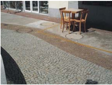
Aspecto da apropriação da calçada no shopping Downtown. Foto das autoras, 2002

Procurando se assemelhar com as tramas de centros urbanos “tradicionais”, o projeto estabelece quarteirões de blocos de salas e lojas, onde a fachada busca quebrar visualmente a unidade da construção, diferenciando os imóveis com diferentes tratamentos justapostos. Esse caráter cenarístico do empreendimento proporciona ao cliente-usuário uma noção de escala ponderável, diferente do que aconteceu no projeto da maioria dos centros comerciais anteriores da Barra da Tijuca.