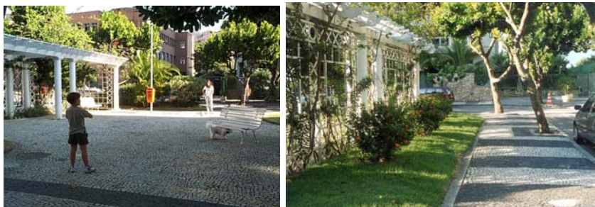
Aspectos da Praça Ministro Vitor Nunes Leal.

os bancos, canteiros de plantas centrais, grades limitantes das calçadas, assim como treliças e pérgolas. Embora o conjunto da praça e a rua asfaltada ao seu redor sejam de natureza legal pública, o respeito ao uso residencial e o fechamento físico ao ambiente urbano acarretam na dominância por parte daquela comunidade.