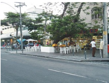
Aspecto da apropriação das calçadas na Avenida Olegário Maciel.

Os elementos marcadores como mesas e cadeiras de plástico podem ser removidos ou rearranjado com facilidade e de acordo com o interesse do momento. Notamos existir o uso do material em concordância entre clientes e estabelecimentos, como casas de sucos, lotéricas, etc. A possibilidade de desenvolver atividades de estar em frente a comércio de interesses de confraternização é um atrativo para os usuários e interessa-os sua participação na organização.