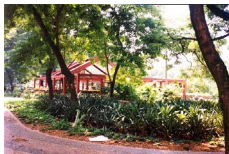
Praça Antero de Quental no Leblon Foto da autora, 1999