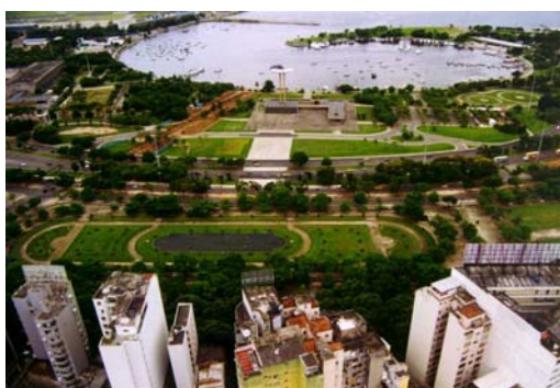
Praça Paris na Glória