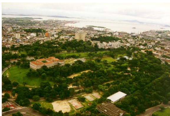
Foto aérea da Quinta da Boa Vista Foto: Silvio Macedo, 1999 – Arquivo PUZN