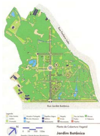
Planta do Jardim Botânico

Foto: Silvio Macedo, 1999 – Arquivo PUZN