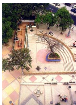
Praça Agripino Grieco no Méier