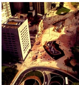
Vale do Anhangabaú