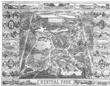
Figura 2 - Central Park em litografia de John Bachmann, 1863

A proliferação dos parques, a sofisticação no seu equipamento e programação, a diversificação do plantio vegetal, a incorporação da estética oriental e a frequência assídua dos moradores de classes de renda mais alta foram aspectos que transformaram os parques ingleses e franceses no padrão de projeto para uma série de espaços públicos, implantados também nas Américas. Glaziou, no Rio de Janeiro, com o Campo de Santana, e Olmstead, em Nova Iorque, com o Central Park, são exemplos paradigmáticos de profissionais que trabalharam sob essa influência. (Figuras 2 e 3)