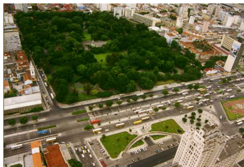
Figura 3-Campo de Santana