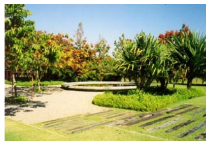
Parque da Gleba E Foto da autora, 1999