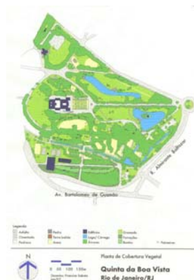
Planta geral da Quinta da Boa Vista