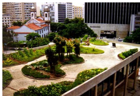
O terraço e os jardins do MEC