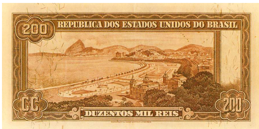
Figura 8- Enseada de Botafogo e a Av. Beira Mar