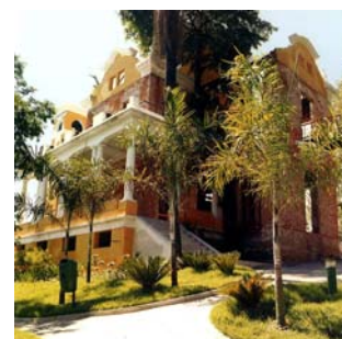
Parque das Ruínas em Sta Tereza