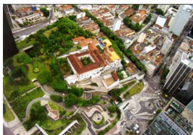
Largo da Carioca