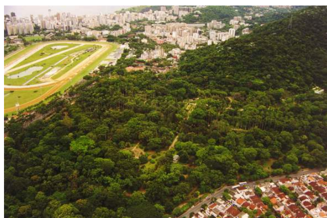
Foto aérea do Jardim Botânico