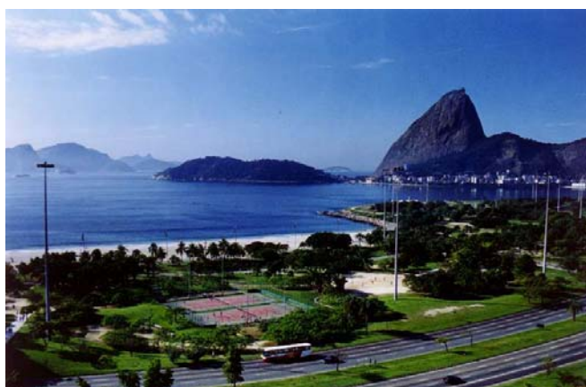
Parque do Aterro do Flamengo Foto: Marcos London, 1998 – Arquivo PUZN