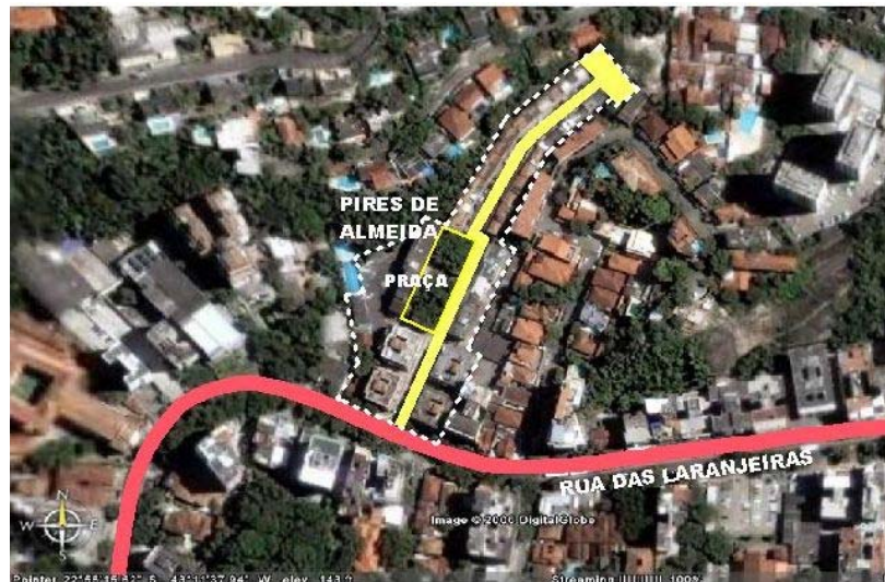
Figura 1 – Localização do conjunto arquitetônico da Rua Pires de Almeida

Como objeto de estudo escolhemos a Rua Pires de Almeida, em Laranjeiras (Fig. 1), em função de sua escala, de ser um dos quatro estudos de caso da pesquisa Desenho Urbano e Qualidade do Lugar 3 que originou o presente estudo, e pelos seus atrativos reconhecidos e apreciados pelos moradores e usuários, que se refletem no valor de comercialização no mercado imobiliário da cidade do Rio de Janeiro.