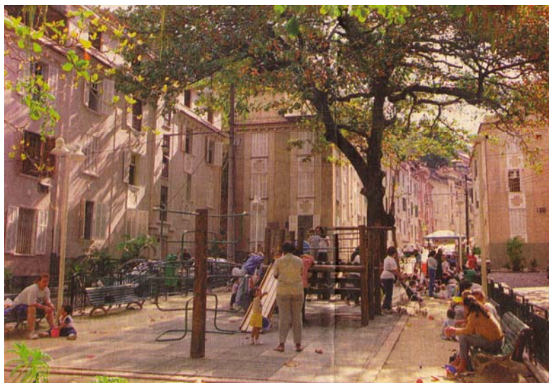
Figura 2 – Foto da Praça Mucio Leitão

“a tranquilidade e a segurança da vila fazem com que crianças e jovens possam brincar e conversar até altas horas na pracinha, eleita o point do lugar. “Todos os meus amigos estão aqui. Todo mundo se conhece e eu posso ficar até uma, duas horas da madrugada na pracinha. Aqui é muito tranqüilo”, diz Cristiane Martins, 17 anos.” 12