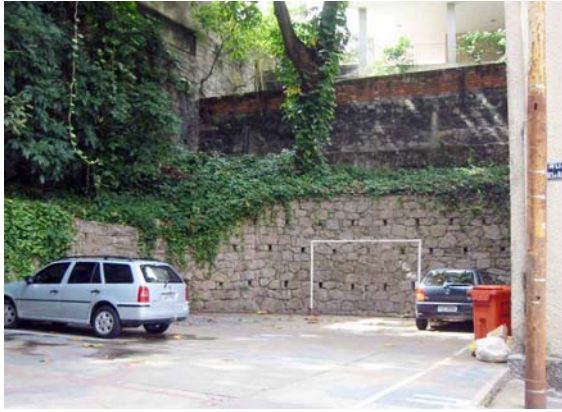
Figura 8 – Cul-de-sac no final da rua