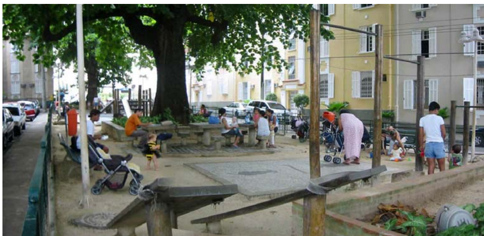
Figura 5 – Praça Mucio Leitão, amplamente usada todos os dias para o lazer infantil

Continuando o percurso em suave acive, no terceiro setor – após a praça – o ambiente se torna silencioso e o sol começa a despontar tornando aquele ambiente diferente do anterior. Apesar da mudança no micro-clima, o “ar” de ambiente bem cuidado e residencial não se alterou: havia jarros de plantas sobre a calçada, que parecia não ser usada para caminhar. As pessoas cumprimentavam-se e transitavam tranqüilas pela rua, dividindo o espaço com os poucos veículos que, eventualmente, passavam.