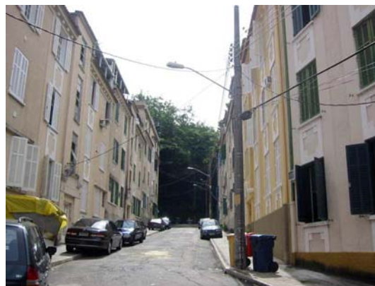
Figura 7 – “Setor popular” com o cul-de-sac sob a densa arborização