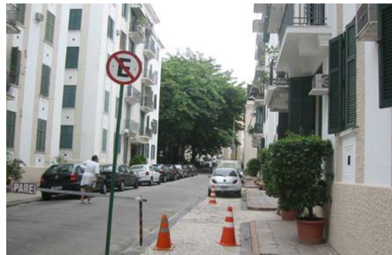
Figura 4 – Vista junto ao Edifício nº 8

Avançando em direção ao interior, no segundo setor que contém a praça, observamos pessoas tranqüilas circulando – em geral mulheres guiando carrinhos de bebês, passeando com seus cães ou saindo para o trabalho. Suas expressões serenas demonstram o quanto o ambiente influencia seu cotidiano: rua arborizada, pouco barulho, boa iluminação e ventilação, microclima agradável e uma sensação de segurança. A Pires de Almeida é uma rua simpática e acolhedora.