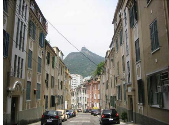
Figura 9 – Vista da rua a partir do cul-de-sac