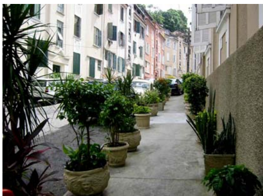
Figura 6 – início do “setor popular” do conjunto

Este trecho em acive e sem saída se torna mais deserto e o ambiente, gradualmente, mais “frio”: menos pessoas circulando, muita alvenaria e nenhuma vegetação (fig. 6 e 7), presente apenas no final do percurso. Um muro de arrimo em pedra-de-mão contornando o cul-de-sac provocou incômodo visual (Fig. 8). O muro “oprime” a quadra de futebol de salão do cul-de-sac que, durante a semana é utilizada como estacionamento e, nos finais de semana, para animadas partidas, jogos de pingue-pongue e sessões de skate ; de lá é possível avistar a imagem do Cristo Redentor, enquadrada pelos edifícios (Fig. 9).