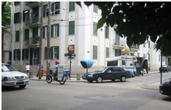
Figura 3 – Esquina com a rua das Laranjeiras/Edifício nº 7 13

Ao longo do percurso percebemos três setores com aspectos distintos: no início a presença de uma guarita com cancela, para o controle de veículos, dá a impressão de ser um condomínio fechado (Fig. 3). No primeiro setor, observamos que os edifícios são todos alinhados com a rua e têm cinco pavimentos com suas fachadas pintadas na cor branca e em cores em tons pastéis, janelas de madeira nas cores branca e verde, venezianas com abertura para o exterior. Estes atributos transmitem a sensação de estarmos entrando em uma cidade do interior relativamente antiga (Fig. 4).