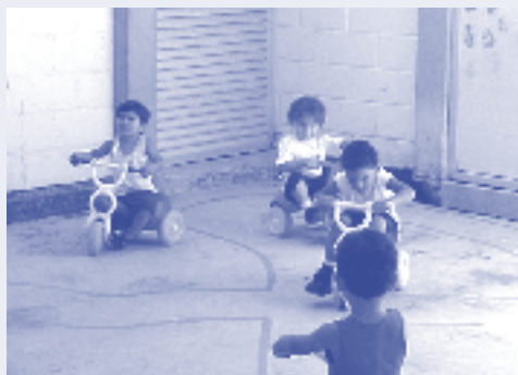
Creche da UFF – Universidade Federal Fluminense

A história de atendimento à criança em idade anterior à escolaridade obrigatória foi marcada, em grande parte, por ações que priorizaram a guarda das crianças. Em geral, a Educação Infantil, e em particular as creches, destinava-se ao atendimento de crianças pobres e organizava-se com base na lógica da pobreza, isto é, os serviços prestados – seja pelo poder público seja por entidades religiosas e filantrópicas – não eram considerados um direito das crianças e de suas famílias, mas sim uma doação, que se fazia – e muitas vezes ainda se faz – sem grandes investimentos. Sendo destinada à população pobre, justificava-se um serviço pobre. Além dessas iniciativas, também as populações das periferias e das favelas procuraram criar espaços coletivos para acolher suas crianças, organizando creches e pré-escolas comunitárias. Para tal, construíram e adaptaram prédios com seus próprios e poucos recursos, o que seguem fazendo na ausência do Estado.