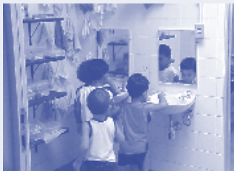
Creche da UFF – Universidade Federal Fluminense

Vale registrar que, segundo dados mais recentes do MEC (Brasil, 2003), se identificam melhoras em relação às condições sanitárias encontradas nos estudos realizados até 1998. Isso pode significar que se tem buscado responder às novas exigências legais. Entretanto, tais informações dizem respeito a estabelecimentos credenciados (autorizados para funcionar). Assim sendo, podemos afirmar que ainda há estabelecimentos, principalmente os que estão fora do sistema formal, mas não só eles, atendendo crianças em ambientes com condições precárias.