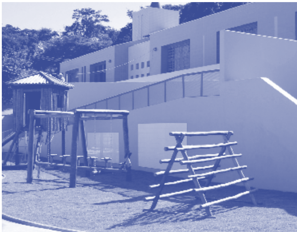
Unidade Municipal de Educação Infantil do Bairro Juliana Prefeitura de Belo Horizonte.

Este trabalho, portanto, busca ampliar os diferentes olhares sobre o espaço, visando construir o ambiente físico destinado à Educação Infantil, promotor de aventuras, descobertas, criatividade, desafios, aprendizagem e que facilite a interação criança-criança, criança-adulto e deles com o meio ambiente. O espaço lúdico infantil deve ser dinâmico, vivo, “brincável”, explorável, transformável e acessível para todos.