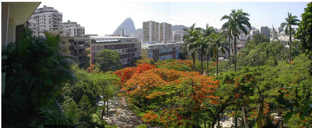
Fig. 1 – Vista Geral do Parque Guinle na época de floração com os edifícios projetados por Lucio Costa (1948-1952) e o Palácio das Laranjeiras em segundo plano.