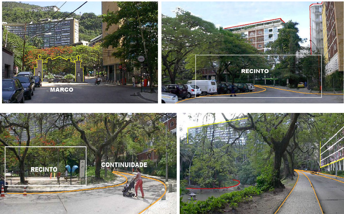
Figuras 2a, 2b, 2c e 2d - Técnica de visão serial usada para análise visual do Parque Guinle através da identificação dos elementos estruturais lynchianos e dos critérios definidos por Cullen

A técnica de visão serial tem por propósito o registro de imagens do ambiente urbano – através de croquis de observação ou registros fotográficos –, de modo a configurar determinados percursos que identifiquem os elementos físicos estruturais. Para a avaliação perceptivo-cognitiva foram analisados os elementos componentes da legibilidade e estrutura formal do espaço, definidos como nós , percursos , limites , setores e marcos (Lynch, 1960), em acordo com os critérios de análise visual do townscape de Cullen (1996). A operacionalização do método partiu da escolha das rotas a serem percorridas sobre as quais foram feitos registros fotográficos a cada cem metros aproximadamente e algumas tomadas de detalhes significativos que chamaram à atenção durante o trajeto (Figs. 2a, 2b, 2c e 2d).