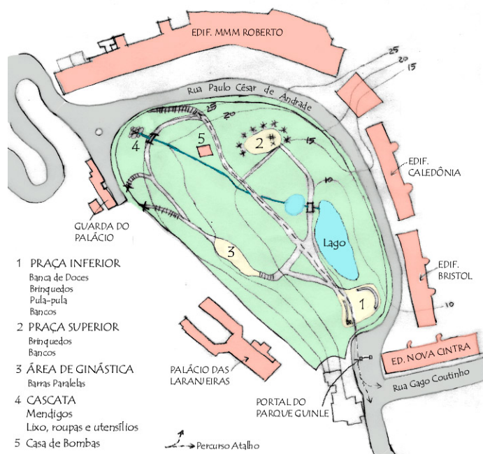
Figura 4 – Mapa-croquis com anotações de observação "desincorporada" do Parque Guinle

A observação direta de um ambiente lida com fenômenos também diretos, permitindo ao observador graduar sua presença ou participação no cenário de acordo com a intenção da pesquisa. Estando em contato direto com o fenômeno, foi possível perceber sutilezas do comportamento não expressas através de entrevistas e questionários formais. Por ser dinâmico, o método permitiu ainda identificar padrões e desvios significativos de conduta, os efeitos das atividades entre si e as cadeias de reações.