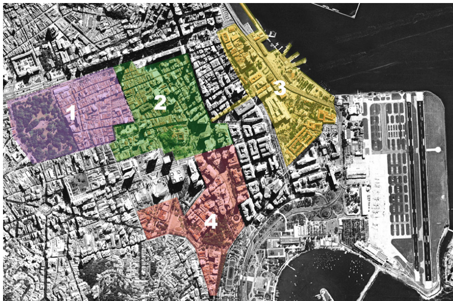
Figura 1 – Área total de abrangência do Projeto Corredor Cultural no Rio de Janeiro, com as 4 sub-áreas demarcadas:

Recortes na área de abrangência do Projeto (Figura 1) foram determinados em nosso estudo para que fossem definidas, mapeadas e analisadas comparativamente as características físicas de cada um e, posteriormente, para que possa ser feito um estudo sobre a influência da cognição na análise e na avaliação do ambiente urbano. Este ensaio apresenta a proposta metodológica que direcionou a escolha do recorte e o estudo morfológico representativo da sub-área 2 – URUGUAIANA.