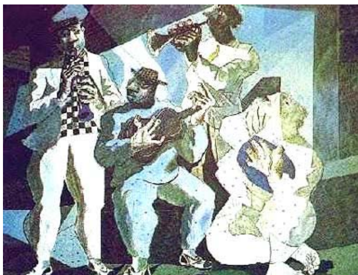
Figura 2 - A roda de chorinho como uma analogia às interações homem-ambiente, intersubjetivas e indissociáveis, que emergem da ação de dar e receber entre eles.

Fazendo uma analogia entre acoplamento e as interações do usuário com um ambiente urbano, é possível perceber que o ambiente emite estímulos e influencia as capacidades sensorio-motoras e cognitivas do observador ou usuário, que reagirá a eles não de forma independente, nem como se aqueles estímulos estivessem ali antes de sua presença. O calor de um ambiente, sua luz, suas cores, matizes e texturas, seus sons, sua ambiência, entre tantos outros estímulos serão percebidos incorporadamente e fazem emergir no indivíduo a consciência daquela experiência do ambiente de forma recíproca e indissociada por meio de sentimentos, ações e comportamento que, por sua vez, não estão dissociados de seu contexto histórico, cultural, social, etc.