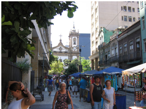
Figura 3 - Final da Rua dos Andradas com o aparente alargamento do espaço e a apropriação das calçadas pelos camelôs