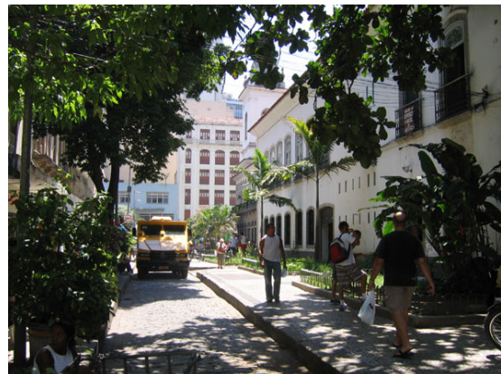
Figura 4 - Beco do Rosário, oasis arborizado e tranquilo no centro da cidade