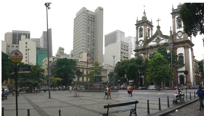
Figura 5 - Largo de São Francisco em um dia sem sol. Notar o pequeno numero de usuários no local