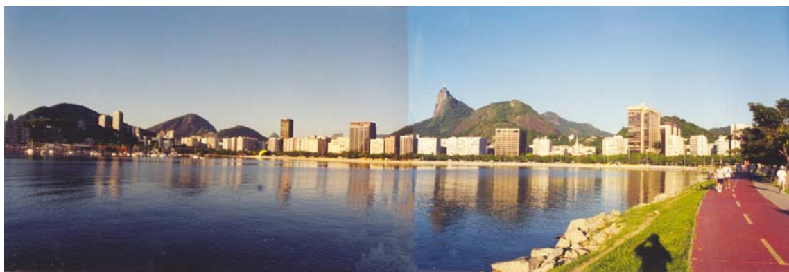
Figura 2 – Vista panorâmica da enseada de Botafogo a partir do Morro da Viúva: relação aleatória entre a massa edificada e o perfil natural dos morros, fruto da prevalência da concepção do edifício como obra isolada de arquitetura em detrimento de seu relacionamento com o contexto; arquitetura como protagonista do processo de degradação da paisagem natural.

Diante da impossibilidade de evitar a interferência do observador-sujeito em sua relação com o ambiente construído, e entendendo ser necessário fornecer indícios da minha visão de mundo, procuro compartilhar uma leitura bem pessoal da enseada de Botafogo (Fig. 2), onde residi por dez anos. Para tanto, procuro integrar em um único texto as visões de morador, de cidadão, de arquiteto, de professor de projeto e de pesquisador.