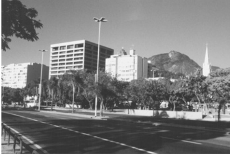
Figura 4 – Vista do edifício Caemi, de dois edifícios de moradia bloqueando a vista do Corcovado, campanário da Igreja da Conceição – marco vertical no início do Século XX e viaduto em meio à arborização; descompromisso com a paisagem natural e desproporção da massa edificada.

Os quatro primeiros fatores estão relacionados com o olhar profissional de um arquiteto interessado em compreender as consequências materiais da intervenção humana no ambiente. Os dois últimos fatores estão relacionados com a possibilidade de aproveitar a experiência acumulada em diversas observações na construção de um instrumento capaz de integrar e ponderar os valores e os significados para os diversos grupos envolvidos com a produção, o consumo e o uso do ambiente construído e a Praia de Botafogo.