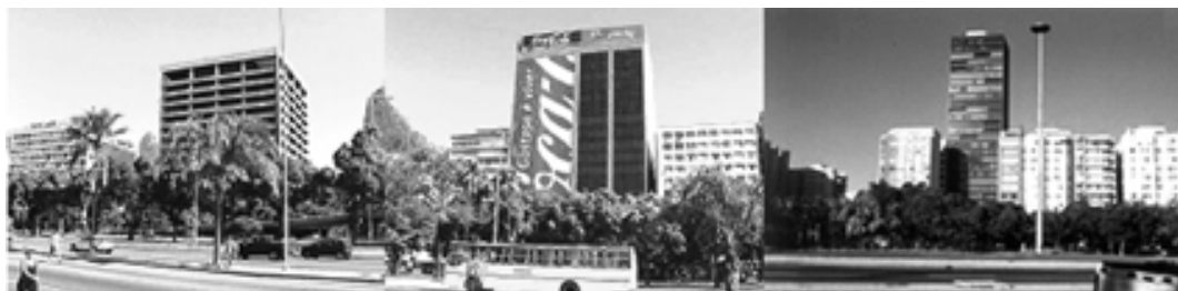
Figura 8 – (a) Edifício Caemi; (b) Edifício Coca-Cola/Intelig; (c) Edifício 440 – “Transatlânticos na Calçada”

A segunda concepção é representada pela transposição mimética do Internacional Style e seus edifícios-máquina de trabalhar, localizados, concebidos e ocupados segundo uma lógica de exploração predatória das condições locais e de exclusão das relações sociais que ocorrem em seu entorno: os “transatlânticos na calçada” escolhem o “porto” mais conveniente para que seu seletivo grupo de “passageiros” possa usufruir, sem preocupar-se com o impacto ambiental. (Fig. 8)