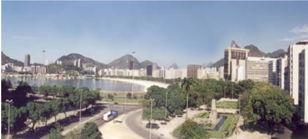
Figura 1 – Vista da Enseada de Botafogo (1999).

Paulo Afonso Rheingantz, Doutor, Arquiteto, Professor da FAU/UFRJ Av. Brigadeiro Trompowski s/n Edifício FAU/Reitoria, sala 443 – Ilha do Fundão Rio de Janeiro/RJ – 21491-590 – Fone (21) 2598-1663 – e-mail par@ufrj.br