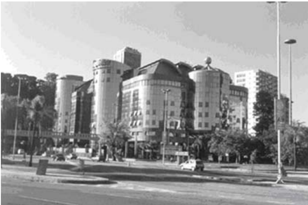
Figura 5. Centro Empresarial Mourisco (2000). Privatização de área pública de proteção ambiental; extravagância formal e de materiais, “ávido por atenção” e casuísmo das autoridades públicas.

Os quatro primeiros fatores estão relacionados com o olhar profissional de um arquiteto interessado em compreender as consequências materiais da intervenção humana no ambiente. Os dois últimos fatores estão relacionados com a possibilidade de aproveitar a experiência acumulada em diversas observações na construção de um instrumento capaz de integrar e ponderar os valores e os significados para os diversos grupos envolvidos com a produção, o consumo e o uso do ambiente construído e a Praia de Botafogo.