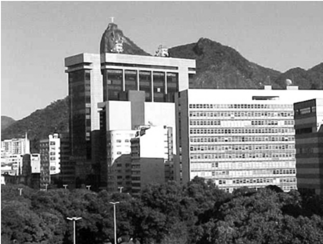
Figura 9 – Vista da janela da sala do meu antigo apartamento, no sétimo andar: bloqueio da vista do perfil das montanhas especialmente do Corcovado.

O resultado desta experiência vivenciada, associado ao conjunto de análises e comentários compõe uma visão topofílica – permeada de afetos e significados – da enseada de Botafogo, pode ser visto como uma evidência exemplar dos resultados da prevalência da concepção do edifício como obra isolada de arquitetura em detrimento de seu relacionamento com o contexto, bem como do casuísmo com que a cidade é tratada pelas autoridades públicas.