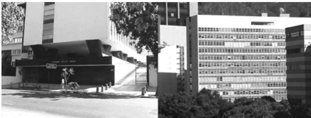
Figura 7 – Edifício da Fundação Getúlio Vargas (1999): (a) parede cega de granito preto, hoje vazada para abrigar a Livraria da FGV; (b) parede-coletor solar.

O edifício da Fundação Getúlio Vargas (1955), exemplar único da proposta de Oscar Niemeyer para construção de “edifícios semelhantes paralelos, equidistantes e com a mesma altura, visando à preservação da silhueta das montanhas ao fundo e da paisagem natural circundante” (Xavier et al 1991: 97), que apresenta os seguintes equívocos: embasamento e lâmina do edifício “opacos”, desprovidos de “olhos” 3 para a via, rompendo a tradicional relação edifício-pedestre; desobediência, pelo próprio autor, do limite de pavimentos recomendado por Niemeyer para os edifícios da orla – fixando para toda a cidade, exceto a Barra da Tijuca, o gabarito máximo de 4 pavimentos (Niemeyer 1980) – para preservar a paisagem natural circundante; desprezo ao clima, ao propor duas cortinas de vidro orientadas para leste e para oeste, condenando os usuários do edifício ao eterno desconforto provocado pelo efeito estufa. (Fig. 7)