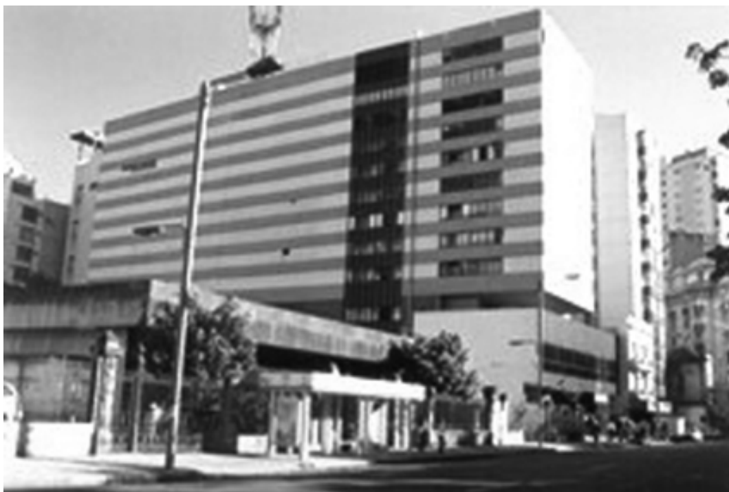
Fig. 6 – Edifício Telemar (2000) – antiga planta industrial praticamente desprovida de aberturas em meio a um cenário deslumbrante – abrigo de ônibus – obstáculo ao fluxo de pedestres – tendo ao fundo o antigo edifício da Livraria da FGV, hoje demolido.

Apesar de sua configuração ter condicionado seu traçado inicial, hoje é possível observar pelo menos dois princípios de ordenamento (Beguin 1991): (a) substituição dos limites naturais pelos limites técnicos, econômicos e políticos – função de passagem do bairro justifica os aterros de alagadiços e as obras viárias (corte de morro, abertura de túnel, construção de viadutos); perfuração da linha 1 do metrô e a construção em área pública de preservação ambiental (postos de gasolina, restaurantes, clubes e edifício de escritórios); e (b) a densidade histórica da cidade dissolve-se em benefício da banalização do urbano – verticalização e densificação imobiliária, mantendo o parcelamento do solo; liberação da taxa de ocupação e do gabarito; permissão para construir edifício praticamente desprovido de janelas. (Fig.6)